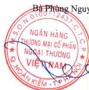
Phó Tổng Giám đốc

Các thuyết minh đính kèm là bộ phận hợp thành báo cáo tài chính riêng giữa niên độ này