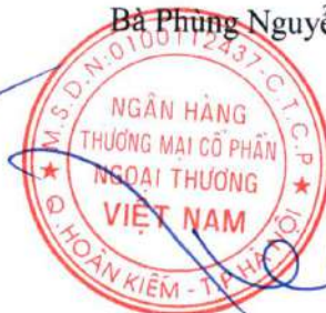
Phó Tổng Giám đốc